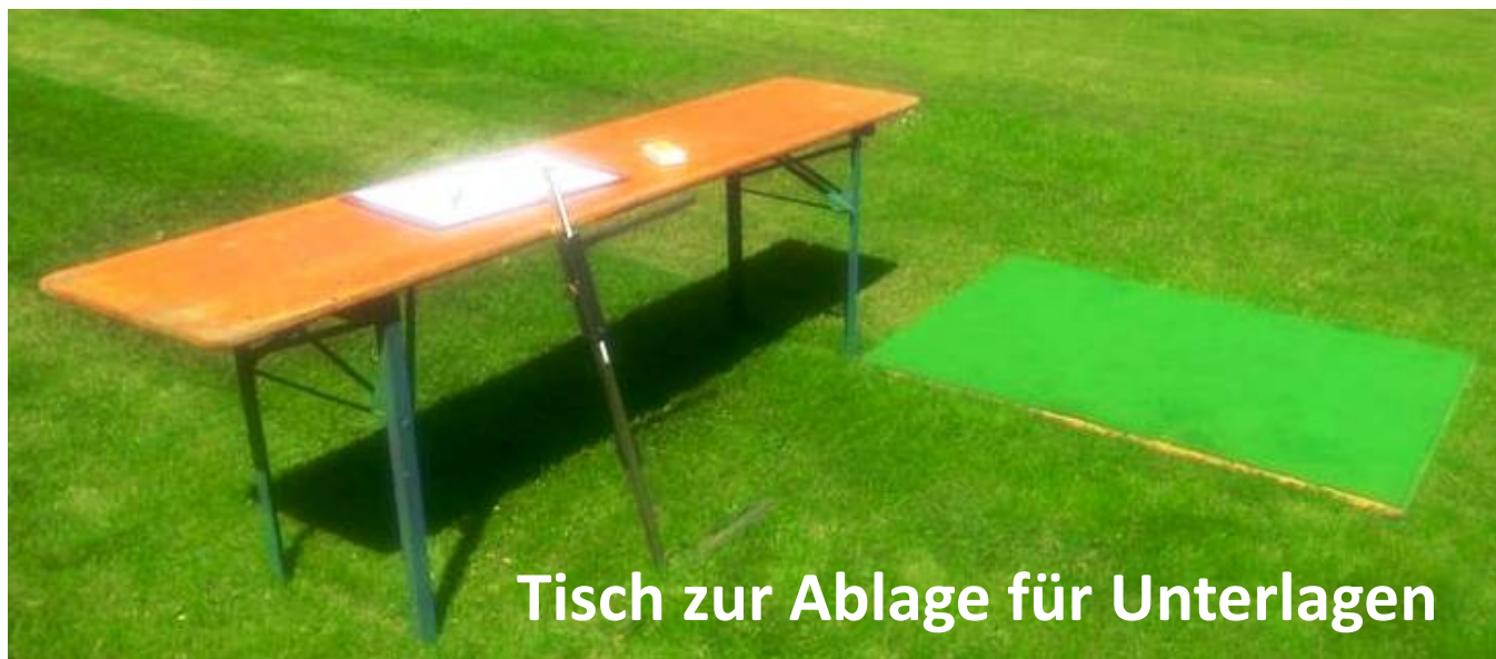
Tisch zur Ablage für Unterlagen